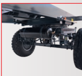
MEDIA DLA DRUGIEJ PRZYCZEPY